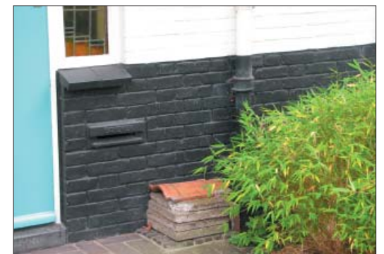
ref: wit gekeimde baksteen met donkere smetstrook