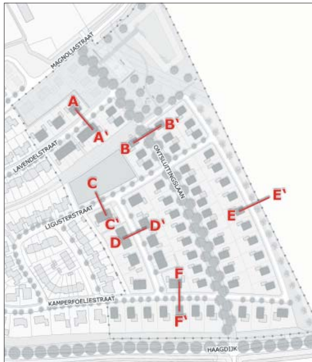
figuur 2: profielen