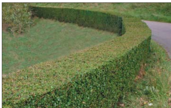
ref: streekeigen erfafscheiding