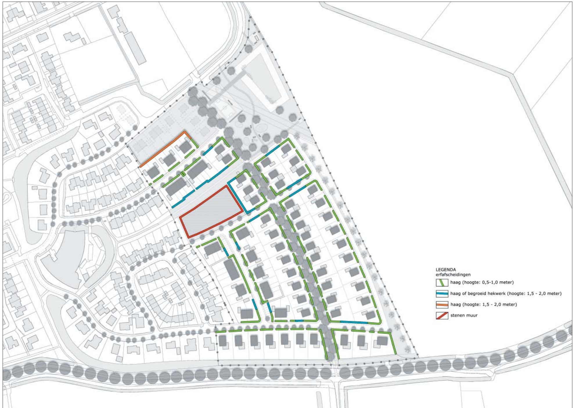
figuur 3: overgang openbaar - privé