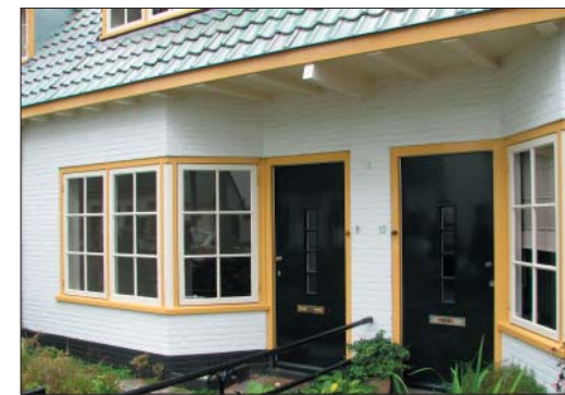
ref : wit gekeimde baksteen met donkere smetstrook