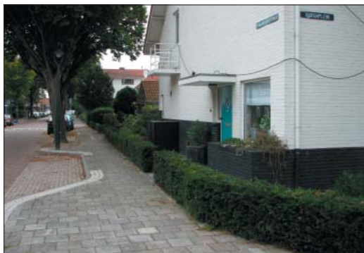
ref: lage streekeigen haag