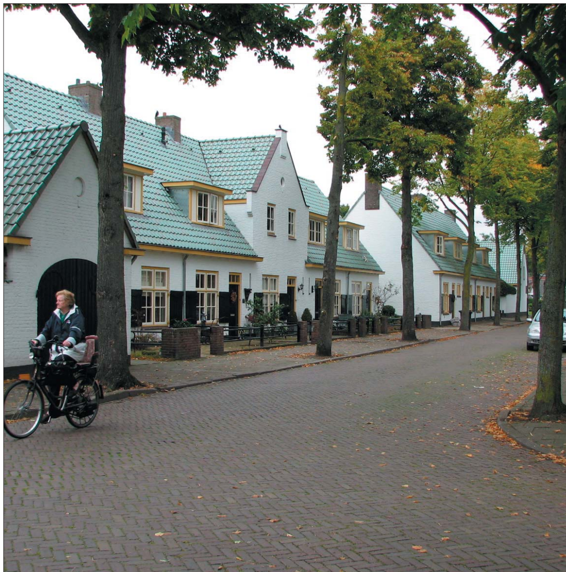
referentiebeelden Hoogstraat te Vught