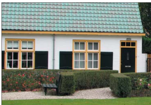
ref: lage streekeigen haag