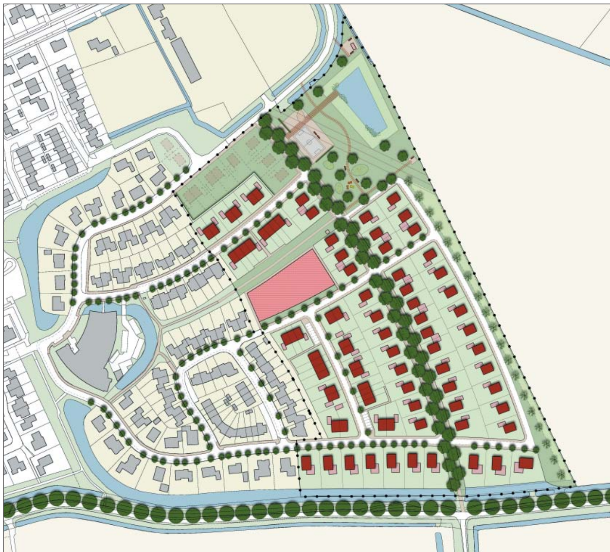
figuur 1: verkevelingsplan

In dit informatieblad worden de beeldkwaliteitseisen voor de bebouwing op de woningbouwlocatie 'Oostgaarde' te 's-Gravenpolder-Oost beschreven. De gemeente Borsele streeft naar een aantrekkelijk ingerichte woonomgeving. De beeldkwaliteitseisen hebben tot doel een ruimtelijke basiskwaliteit te garanderen. Met het vastleggen van een 'spelregelset' per bebouwingscluster wordt beoogd ruimtelijke samenhang te creëren, zowel binnen de buurt als in aansluiting op de bestaande woonbuurt. Voorliggend document vormt een aanvulling op de welstandsnota.