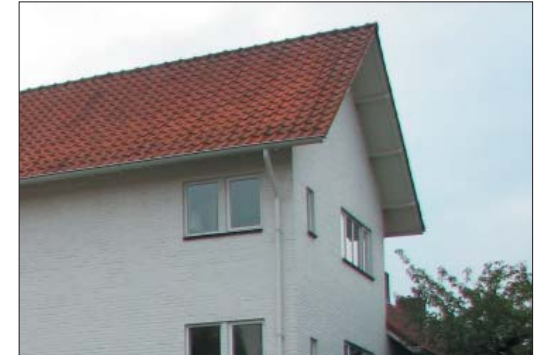
ref: zadeldak met overstek, rode keramische pannen