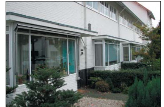
ref: horizontale geleding