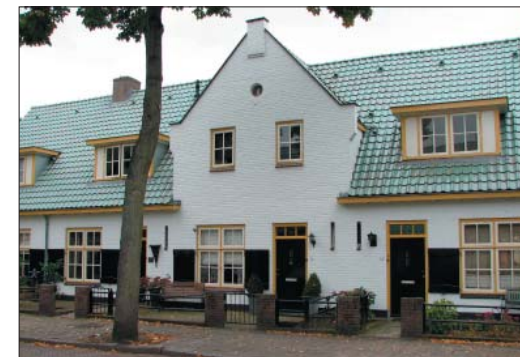
ref: zadeldak met niet nader bepaalde kaprichting