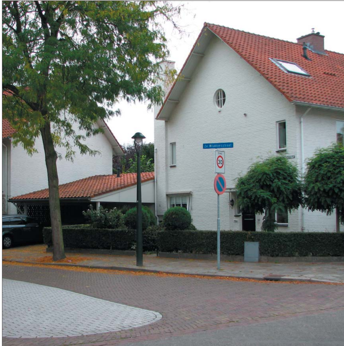
referentiebeelden Het Witte Dorp Eindhoven