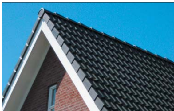
ref: kleur- en materiaalgebruik, zadeldak met overstek